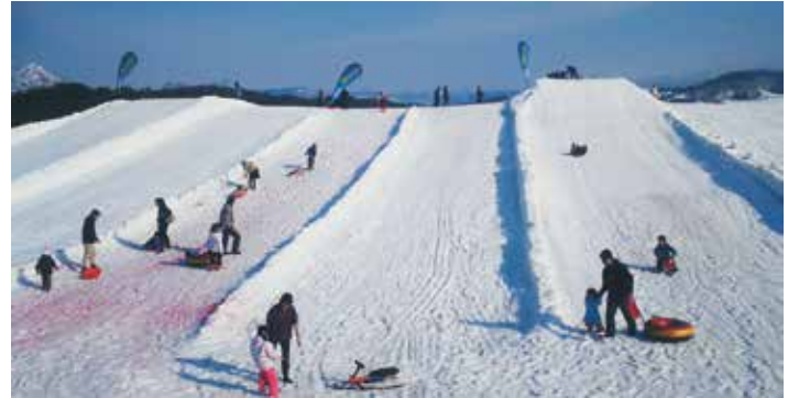
※ソリ、スノーモービル乗車体験は普段どおり実施します